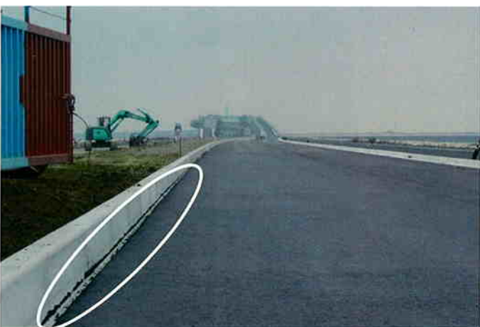
舗装前の状況（下部に凸部が確認できます）