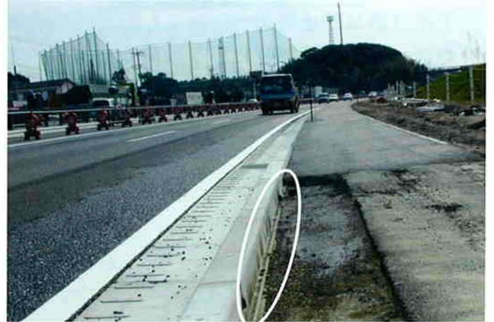
舗装前の状況（下部に凸部が確認できます）