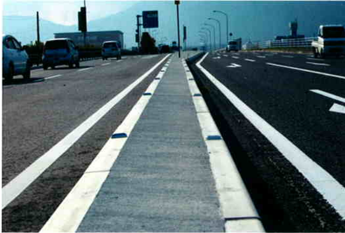
歩車道境界ブロック（マウンドアップ）