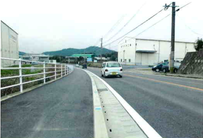
雑草の成長が殆んど確認できない暗渠形側溝と組み合わせて施工された歩車道境界ブロック