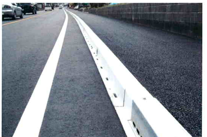
排水型歩車道境界ブロックの施工例